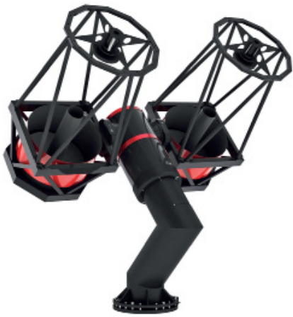
Telescopio ASA con estructura de transmisión directa

Al leer los anillos rotatorios RESM, que van montados directamente sobre los ejes móviles, el encóder TONiC permite eliminar la holgura y los efectos de acoplamiento del encóder y de deslizamiento de los rodamientos. Esto elimina la histéresis mecánica, lo que se traduce en altos niveles de precisión, independientemente del material o de los cambios bruscos de temperatura. Los anillos de acero inoxidable RESM están disponibles en una gama de diámetros estándar que van de 52 mm a 550 mm, con tamaños incluso más grandes disponibles bajo pedido. El anillo de bajo perfil es ideal en aplicaciones con motores de par de transmisión directa.